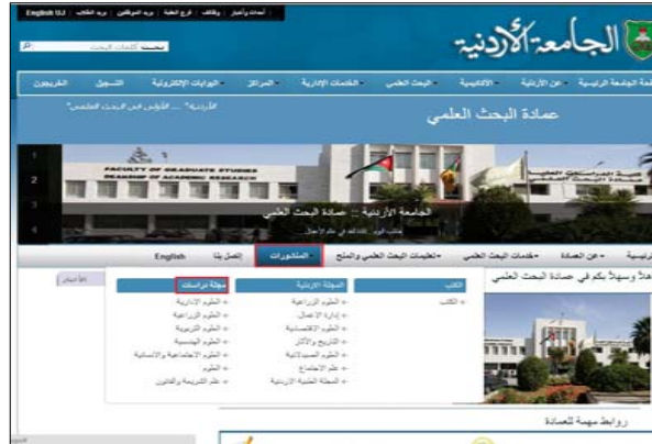
الشكل (١): موقع عمادة البحث العلمي